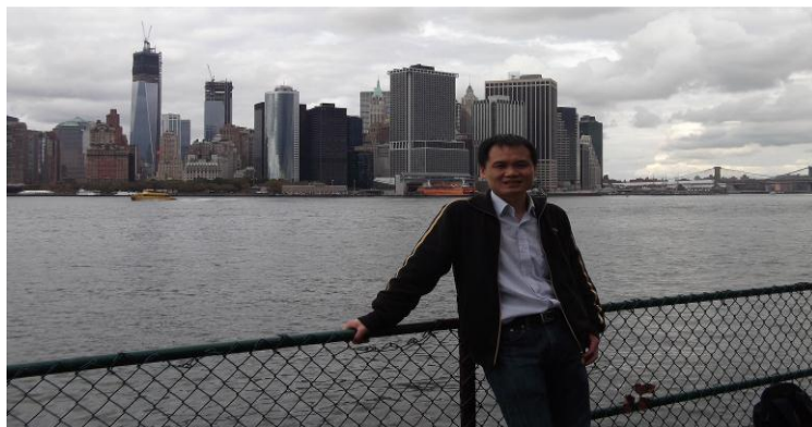
（总督岛上吹风，后面有双子大楼和布鲁克林大桥）